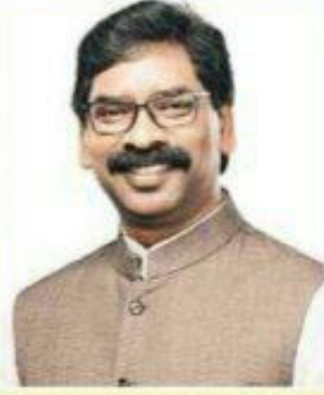
हेमन्त सोरेन माननीय मुख्यमंत्री, झारखण्ड